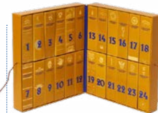
Hartkartonagenbox mit Faltschachteln. Verschließbar mit Band/Schleife/Schnur