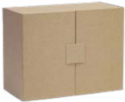
Hartkartonagebox mit Hartkartonagenschubladen. Türen mit Magnet verschlossen