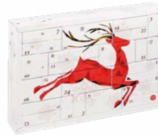
Hohlraumkalender mit Faltschachteln