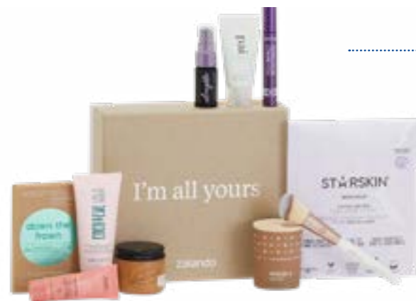
Hartkartonagenbox mit Deckel