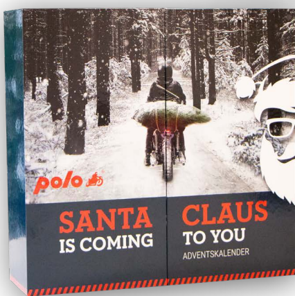
Hartkartonagenbox mit Faltschachteln, optional mit Türen