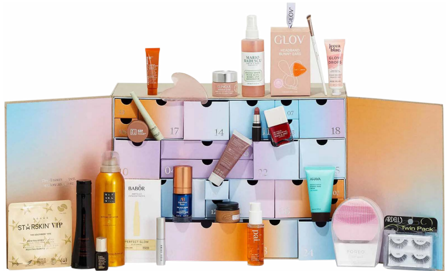
Hartkartonagebox mit Hartkartonagenschubladen. Türen mit Magnet verschlossen