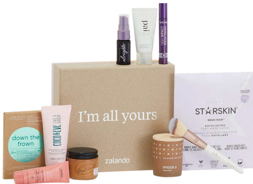
Hartkartonagenbox mit Deckel