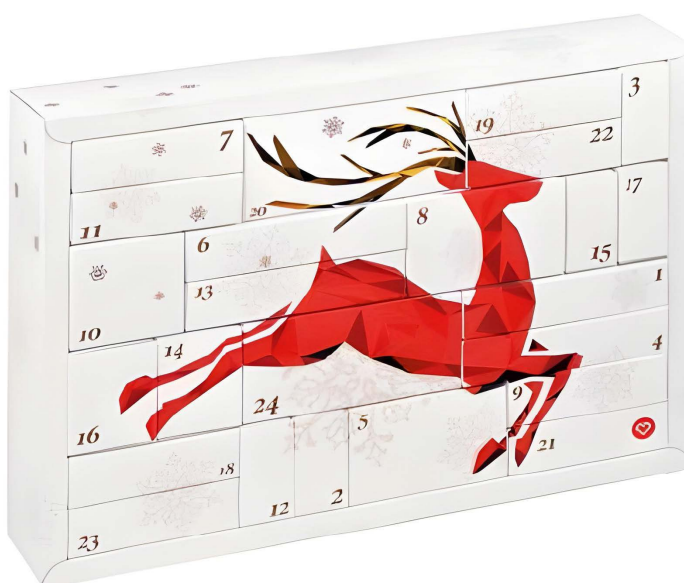
Hohlraumkalender mit Faltschachteln